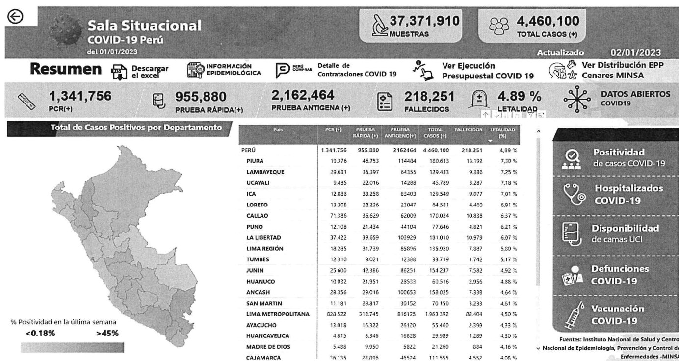
Gráfico N° 1: Sala Situacional COVID-19 PERÚ 01.01.2023

Conforme a la información epidemiológica de la Sala Situacional COVID-19, el número total de casos positivos por el COVID-19 en el Perú, al 01 de enero de 2023 asciende a 4'460,100, con mayor incidencia de letalidad en los departamentos de Lambayeque, Ucayali, Ica, Loreto y la Provincia Constitucional del Callao. Como se puede apreciar en el Gráfico N° 1, la cifra de fallecidos asciende a 218,251 personas, con una letalidad promedio de 4.89%.