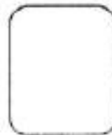
Huella digital Índice derecho